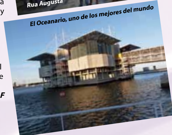
El Oceanario, uno de los mejores del mundo