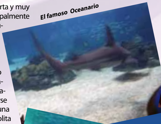
El famoso Oceanario