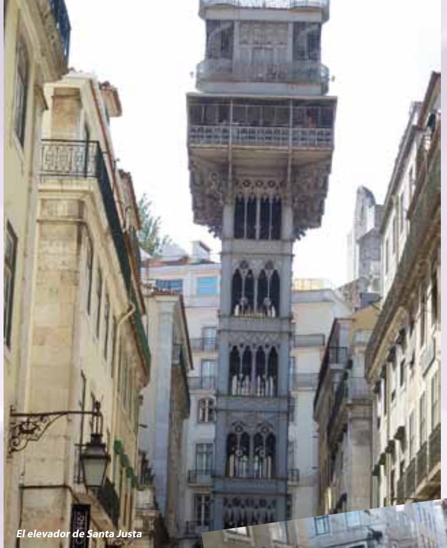
El elevador de Santa Justa

La Lisboa moderna se encuentra en el llamado Parque das Nações. Es un espacio vivo, dinámico y multinacional. Es la marca contemporánea de la ciudad, un lugar donde los lisboetas se divierten, disfrutando de espectáculos, pasean, hacen deportes, van de compras, trabajan y viven. Comprende el área donde se realizó la Exposición Mundial de 1998. Se trata de un gran espacio de disfrute público que unió