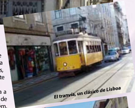
El tranvía, un clásico de Lisboa