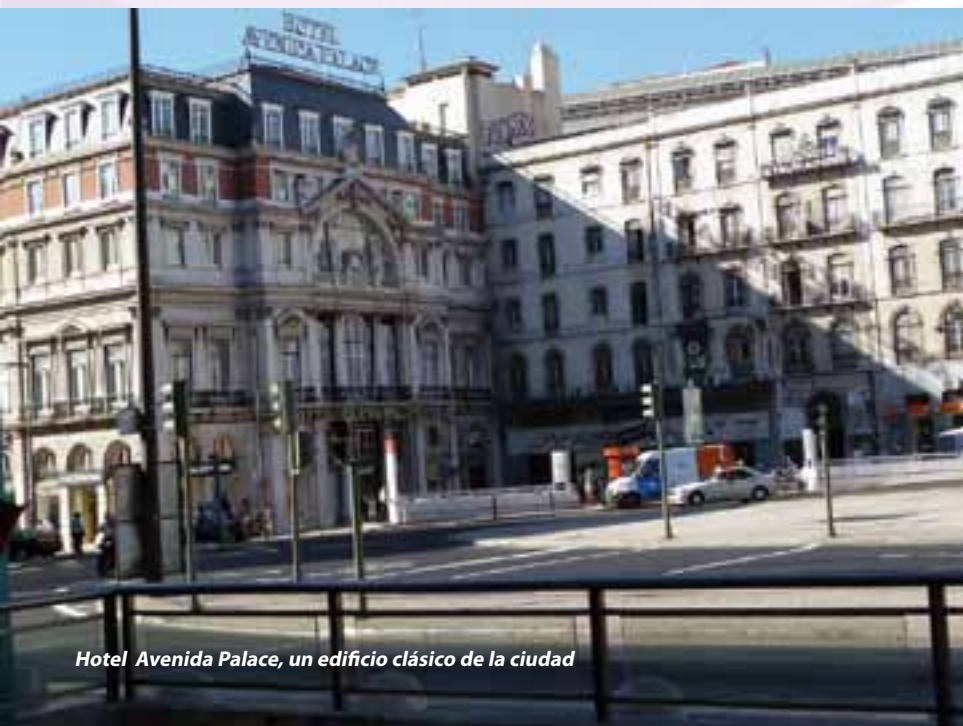
Hotel Avenida Palace, un edificio clásico de la ciudad

la ciudad lusa y que aún circulan los antiguos coches, y lo mismo ocurre con el funicular, ambos son otro de sus atractivos..