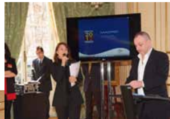
Presentación en Madrid del evento y los premiados por el Turismo de Francia.

En lo que se refiere al mercado español, éste apunta una disminución de tan solo el 2%, a pesar de la crisis económica. España mantiene así su sexta posición como mercado emisor por detrás de Gran Bretaña, Alemania, Holanda, Bélgica e Italia. ●