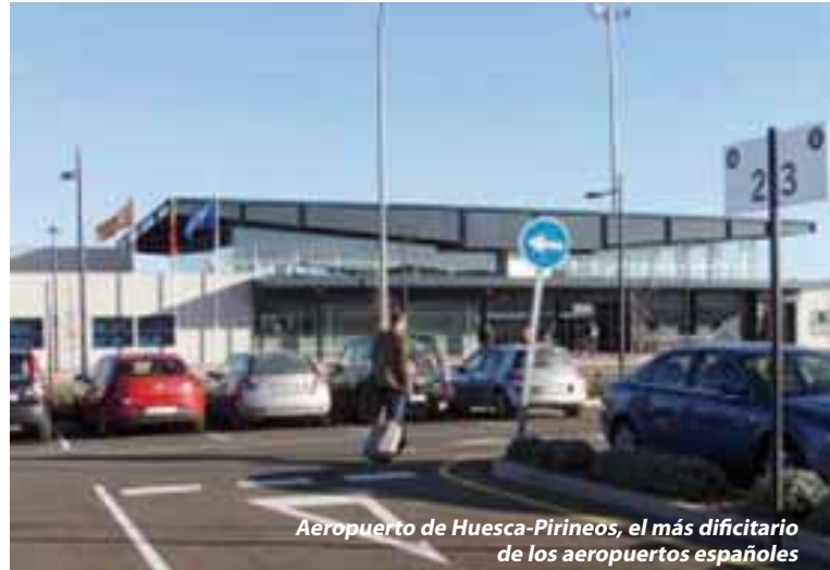
Aeropuerto de Huesca-Pirineos, el más deficitario de los aeropuertos españoles

Con el plan de privatización en marcha que fija 2014 como horizonte, AENA quiere trabajar a fondo sus cuentas para aumentar su valor de cara a los nuevos socios. Tras analizar aeropuerto por aeropuerto, algunos volverán a ser