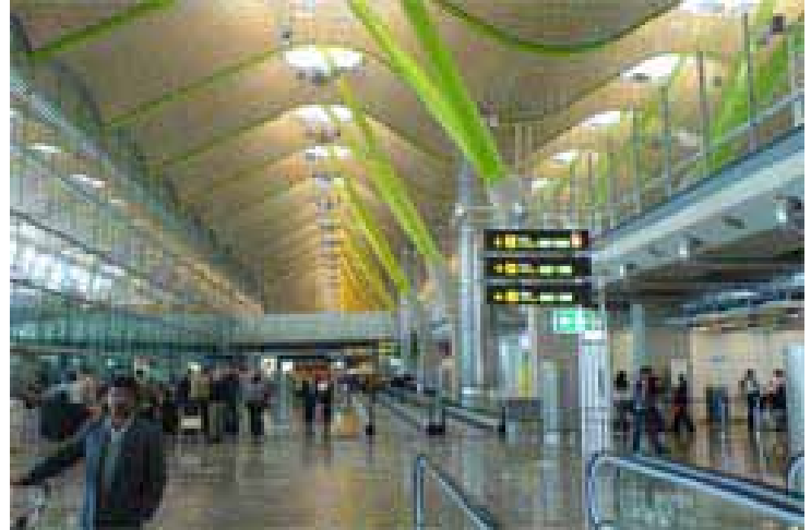
Terminal T4 del aeropuerto de Madrid-Barajas