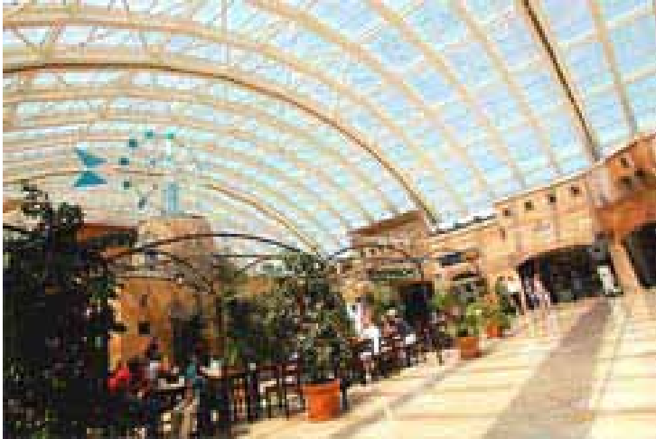
Terminal del aeropuerto de Palma de Mallorca