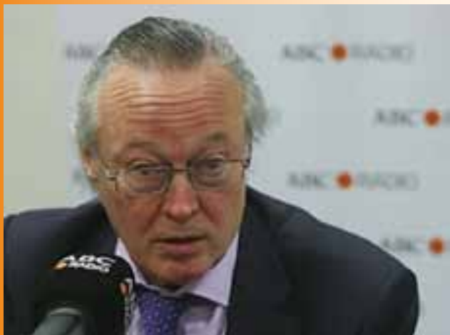
Josep Piqué, presidente de Vueling

Ha reiterado su apoyo a un modelo aeroportuario descentralizado como en los países del entorno y con competencia entre aeropuertos, y ha criticado "catedrales" como la T4 de Barajas y la T1 de Barcelona por su altísimo coste para acabar teniendo exceso de capacidad, pero ha señalado que es una oportunidad de futuro, ya que el resto de grandes aeropuertos europeos no pueden crecer más mientras los dos grandes españoles ya tienen la infraestructura para captar el nuevo negocio venidero. ●