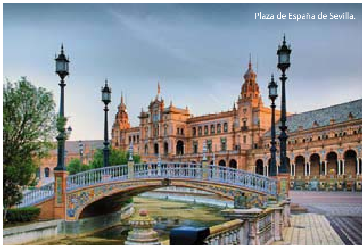
Plaza de España de Sevilla.

Con la entrada de España en el Mercado Común, años más tarde Unión Europea, llegan a nuestro país numerosos ingresos gracias a los Fondos Regionales y al Programa Leader para el desarrollo de un nuevo tipo de turismo como el rural. En la temporada 85-86, comienzan los Programas del Inmerso que tanto han ayudado a desestacionalizar el turismo y permitido que las familias más desfavorecidas, pudieran disfrutar de unos días de vacaciones. En 1987, la Unión Europea inicia la liberalización del transporte aéreo y en España se rompe el monopolio de Iberia e irrumpen en el mercado nuevas compañías como Spanair y Air Europa que compiten bajando las tarifas. El Camino de Santiago es declarado el Itinerario Cultural Europeo. Son unos años en los que los españoles viajan con más frecuencia al extranjero al ser mayor su poder adquisitivo y ser más favorable el tipo de cambio. El turismo sigue creciendo pero con una nueva visión: la cultura del turismo sostenible. Por eso, al año siguiente,