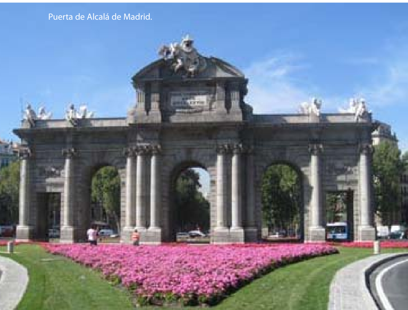
Puerta de Alcalá de Madrid.

Español (Futures). En 1993, se crea el Ministerio de Comercio y Turismo y se inicia el proceso de aplicación de la Agenda 21 para el turismo sostenible. En 1995, con la entrada en vigor del Tratado Schengen, se suprimen los controles aduaneros de personas entre siete países de la U.E., se crean el Consejo Promotor de Turismo y el Instituto de Calidad Hotelera Español (ICHE).