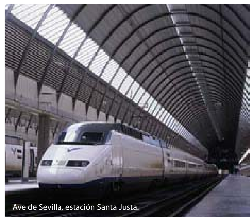
Ave de Sevilla, estación Santa Justa.

El 92 está marcado por importantes acontecimientos como la inauguración del AVE a Sevilla, la EXPO 92 de Sevilla y las Olimpiadas de Barcelona, lo que provocará que se doble y mejore su planta hotelera y se inicia el primer Plan Marco de Competitividad del Turismo