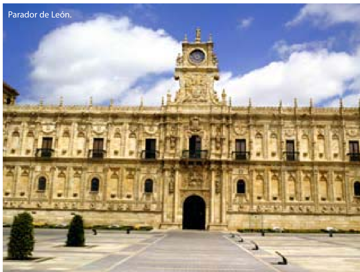
Parador de León.

En años posteriores, el Instituto de Turismo de España, con el fin de reforzar las campañas de promoción de España en el extranjero, realiza numerosos estudios de mercados específicos para obtener una mayor rentabilidad al dirigir las acciones a segmentos concretos de la demanda. En 2005, España alcanza el liderazgo en Europa del turismo de golf con una oferta que llega a los 324 campos de los que disfrutaban más de un millón de turistas extranjeros. En 2006 se pone en marcha el Plan de Impulso del Turismo de Naturaleza en sus tres modalidades de ecoturismo, turismo activo y esparcimiento y recreo en la naturaleza. Continúa incrementándose el número de pasajeros procedentes del extranjero que llegan a las principales Comunidades