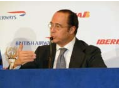
Presidente de Iberia.