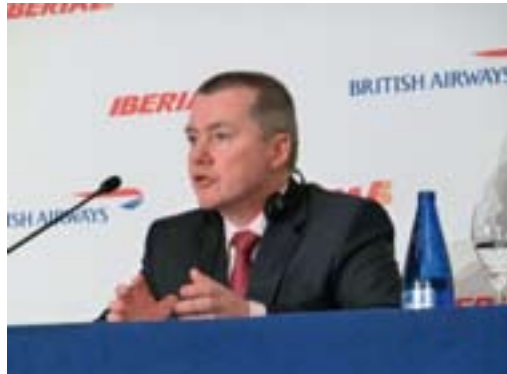
Consejero de British Airways.