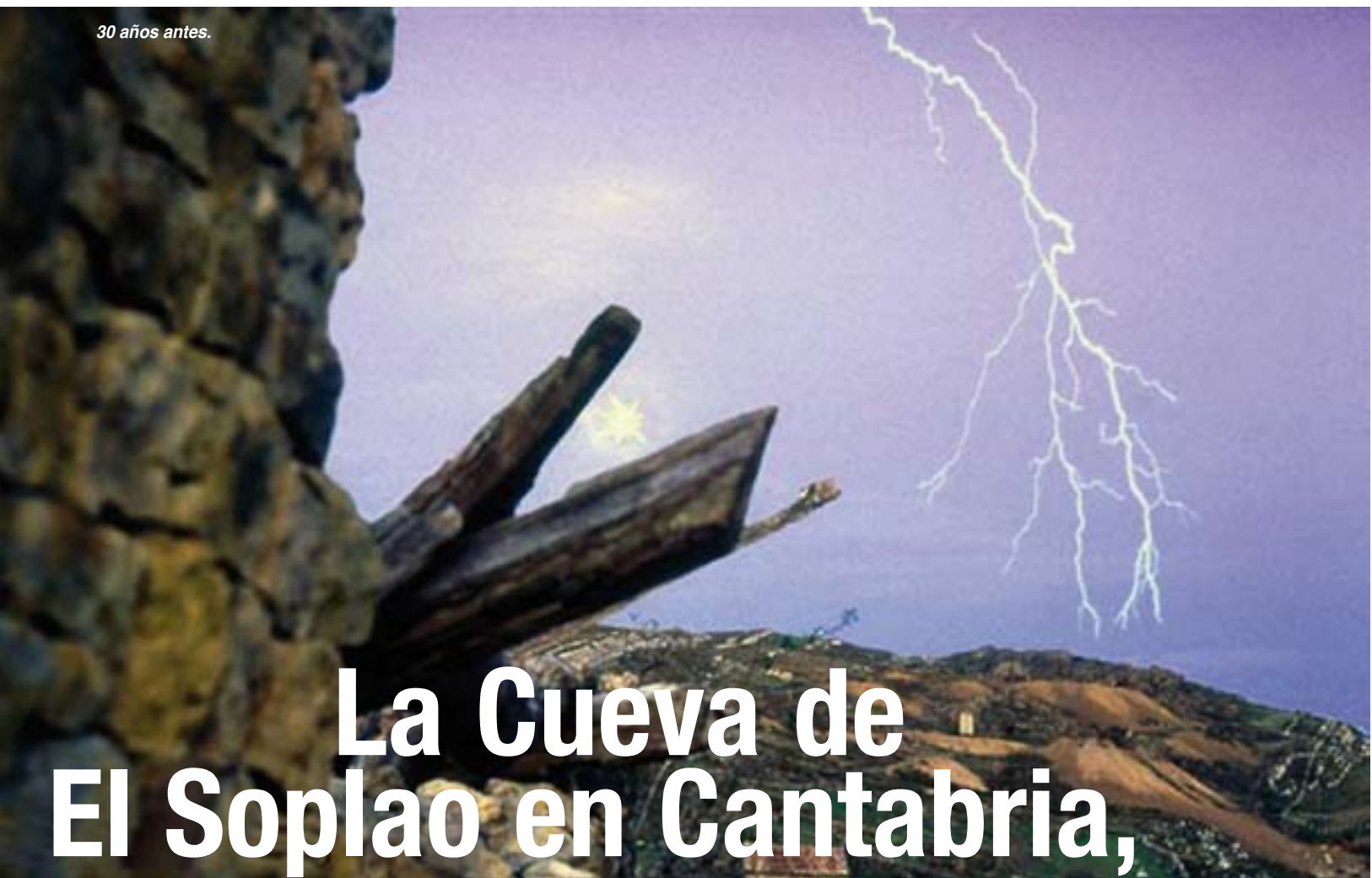
30 años antes.