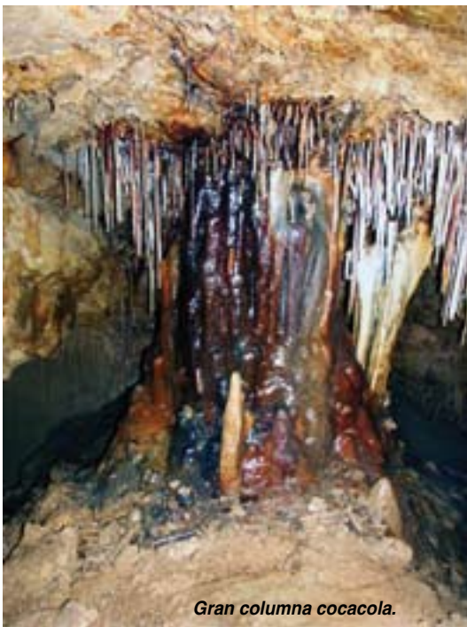
Gran columna cocacola.

tamento técnico correspondiente de la Universidad de Almería. Desde marzo de 2007, el Soplo cuenta con nuevas instalaciones como el Centro de Recepción de Visitantes, edificio de unos 2.700 metros cuadrados útiles que, al igual que el edificio de turismo-aventura, ha quedado soterrado en la ladera en que se ubica Mina La Isidra, al objeto de evitar impactos ambientales negativos. Responde a una arquitectura minera a base de piedra y acero que corten las impresionantes vistas de los Picos de Europa, al Nansa y Peña Sagra. Los efectos dinamizadores son ya notorios, especialmente, en el sector servicios y, sobre todo, en la restauración y la hostelería, ya que más del cuarto de millón de visitantes al año, ha desbordado la capacidad de los establecimientos existentes, comenzando ya la implantación de otros nuevos. Como proyección de futuro, se está avanzando en un anteproyecto de Parque Temático que tendrá como contenidos la minería de La Florida, el bosque atlántico, la ganadería autóctona, la geología, senderos de interés naturalístico, etnografía del Nansa y Saja, entre otros, que irá acompañado de mejoras en las carreteras de acceso y señalización de senderos