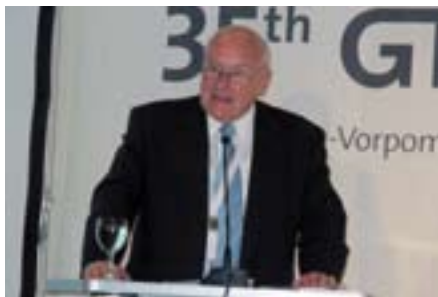
Ernst Hinsken, encargado para turismo del gobierno Alemán.

Como reveló una breve encuesta, cerca del 95% de los encuestados se mostró satisfecho o muy satisfecho con el transcurso del GTM. El 83% de los expositores volverán a participar probablemente o con seguridad el año próximo. Ello reafirma la