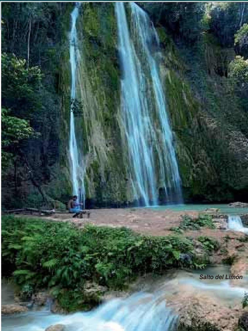
Salto del Limón

La República Dominicana realmente ofrece algo para cada quien. Para aquellos que sueñan con estar de tú a tú con la madre naturaleza, Samaná es el destino perfecto. Situada en la costa noreste del país, la península de Samaná, con sus numerosos lagos y sus paisajes marinos constituye el relieve geográfico más extraordinario de la línea costera del país y la oferta más exótica de turismo dominicano.