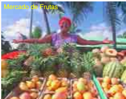
Mercado de Frutas

Aunque si hay algo realmente inagotable en República Dominicana, es la hospitalidad y la alegría de sus gentes. Más de ocho millones de sonrisas dispuestas a hacer de sus vacaciones un recuerdo inolvidable.