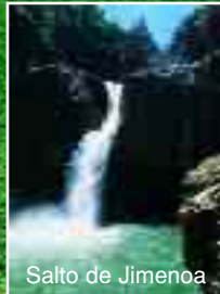
Salto de Jimenoa