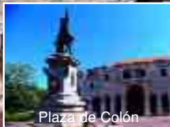
Plaza de Colón