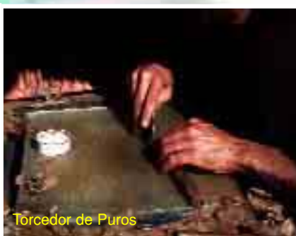
Torcedor de Puros