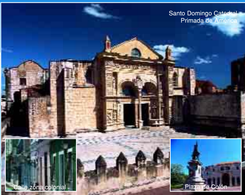
Santo Domingo Catedral Primada de América