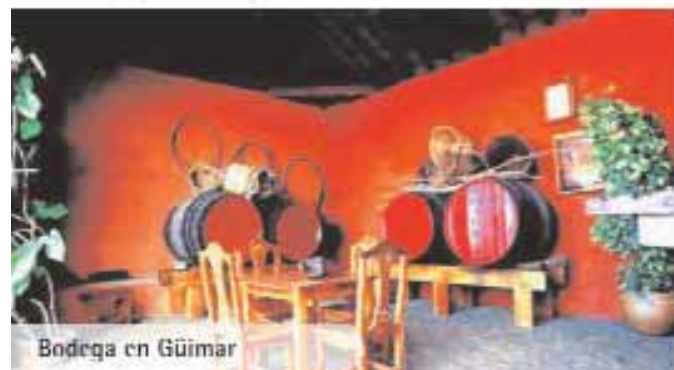
Bodega en Güímar

En Güímar con playas bastante buenas y varias de ellas preparadas los accesos para discapacitados, destacan la de La Entrada en El Socorro, El Puertito de Güímar con el Cabezo y las calas y piscinas naturales de El Tablado, Los Kanancos y Punta Prieta. Con un Club Náutico, donde se desarrollan actividades marinas y