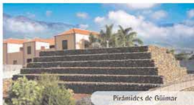
Pirámides de Güímar