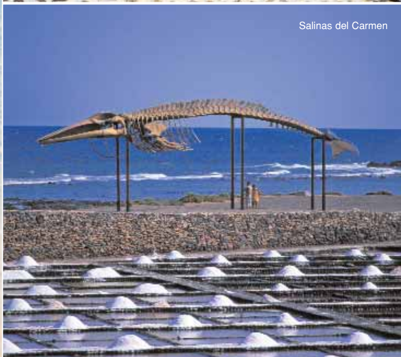
Salinas del Carmen

La población se mantiene estancada en alrededor de los 70.000 habitantes.