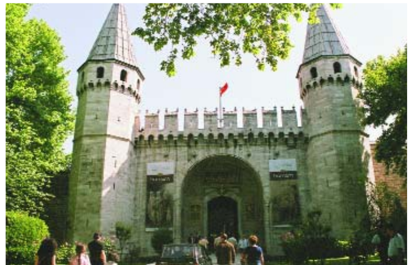
La Puerta de Salutación del Palacio de Topkapı

El Kapahçarsi, es su verdadero nombre y es una de las principales atracciones turísticas que el viajero no debe dejar de visitar y comprar. Fundado en la época otomana, a mediados del siglo XV, fue destruido muchas veces por los incendios. Es un laberinto de calles con mas de 400 tiendas; totalmente cubierto. Situado en la ciudad antigua. El nombre de sus calles corresponde a los artículos que se venden: la calle de los orfebres, la calle de las alfombras... bancos, joyerías, telares, restaurantes, cafés y otros. Aquí es riguroso el regateo para las compras, si se hace pesado y largo te invitan a un té. No hay ningún problema con el español, casi todos los vendedores lo hablan. Debemos hacer un reconocimiento al Instituto Cervantes con presencia en esta ciudad haciendo una gran labor del idioma español