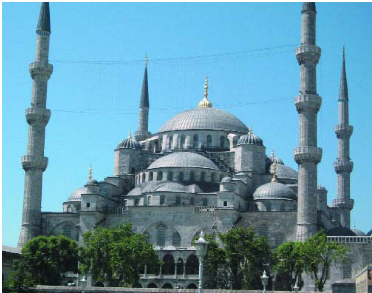
Mezquita de Sultan Ahmet (Mezquita azul)

En el corazón de la ciudad está el Estrecho del Bóforo, por donde corren las aguas del Mar Negro, el Mar de Mármara y el Cuerno de Oro