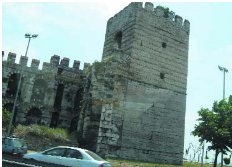
Las antiguas Murallas