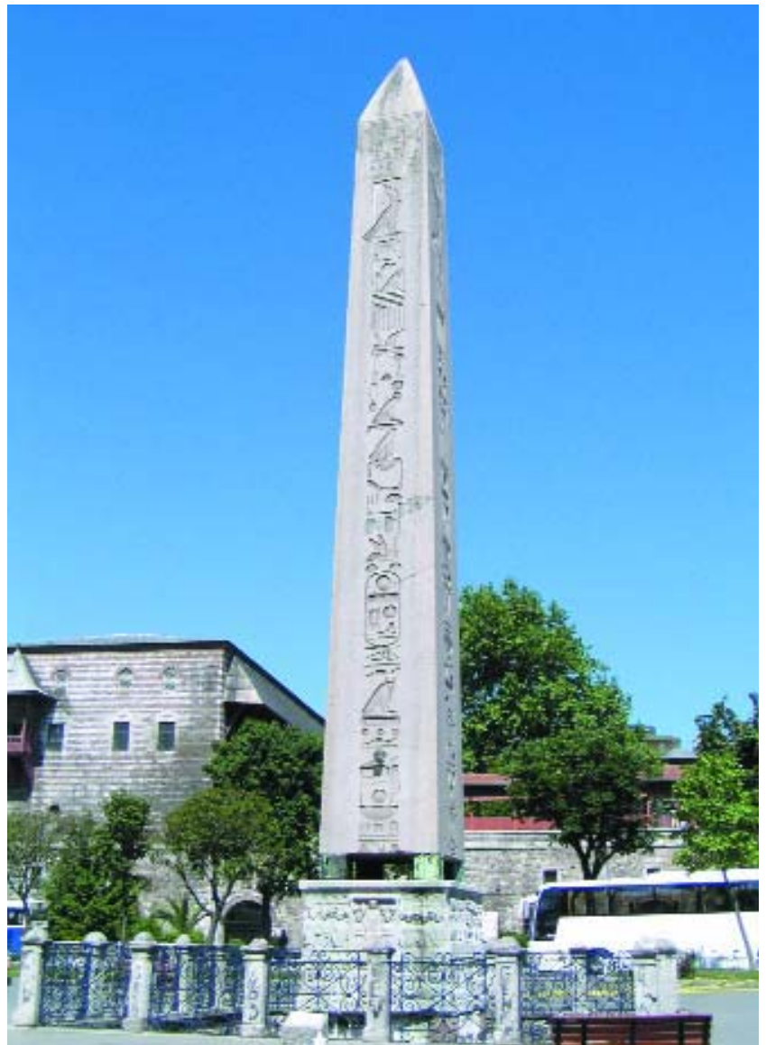
Obelisco de Pórfido, en la Plaza de Hipódromo

Situado en la ribera del Bósforo, construido a mediados del siglo XIX, su fachada se extiende a lo largo de 600