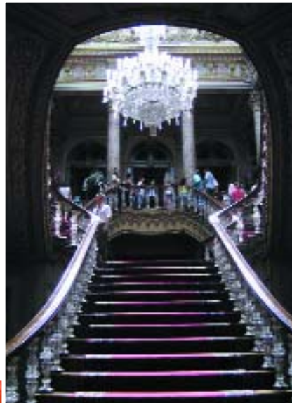
Palacio de Dolmabahce Abajo: Museo de Santa Sofía