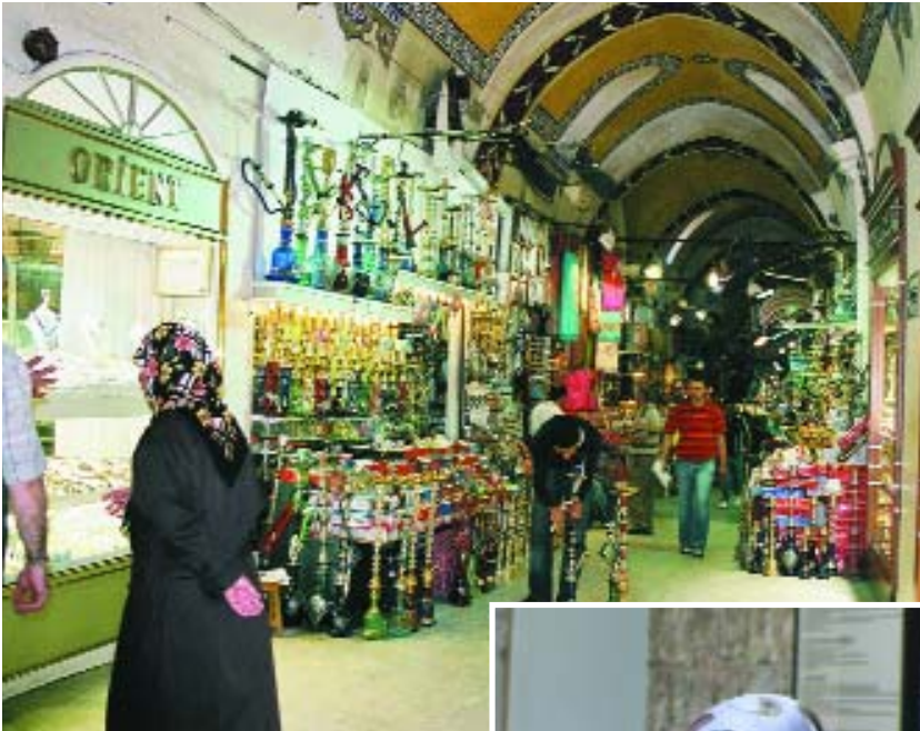
El Gran Bazar