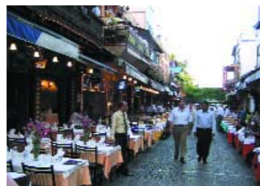
Calle de los Restaurantes

Después de la conquista de Constantinopla por los turcos fue convertida en mezquita, y sus mosaicos y frescos fueron enjalbegados. En 1935 Santa Sofía fue convertida en museo por orden de Mustafa Kemal, fundador de la, moderna República de Turquía y sus mosaicos y frescos fueron limpiados y restaurados.