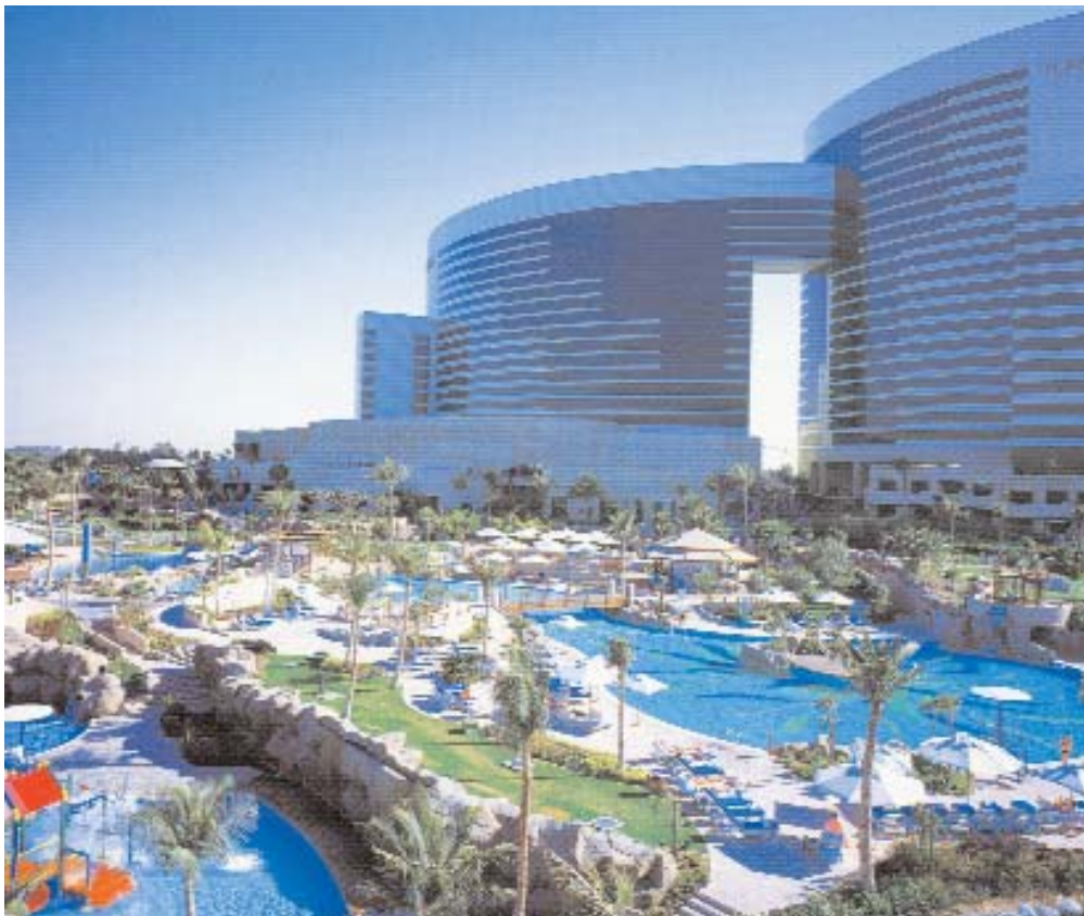
Grand Hyatt Dubai

El segundo con el mismo espíritu, está compuesto por trescientas islas que en su conjunto forman el perfil del mapa del mundo, albergará también edificaciones de lujo, con atraques privados.